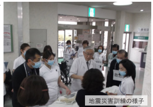
地震災害訓練の様子